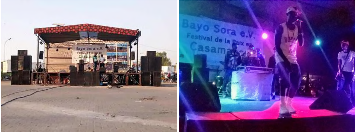
Abbildung 12 Festival Bühne auf dem Place Alioune Sitoé Diatta in Ziguinchor / Künstler auf der Bühne

Von Freitag bis Sonntag traten jeweils ab ca. 18:00 auf der großen, für das Festival gemieteten Bühne am Place Sitoé Diatta lokale und internationale Künstler auf.