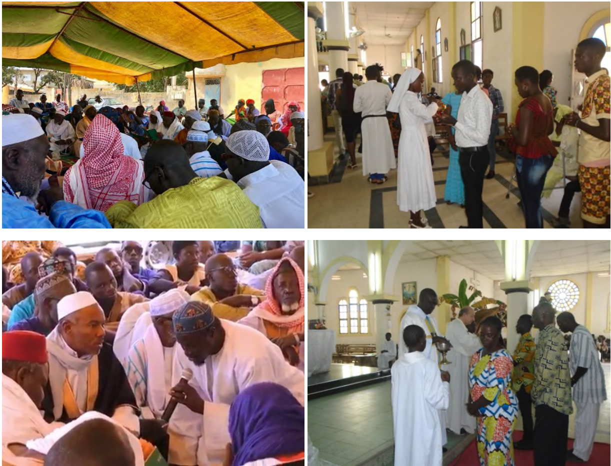
Abbildung 1 Interreligiöse Gebete für den Frieden und das Gelingen des Festivals in Ziguinchor

Den Beginn des Friedensfestivals bildeten auch in diesem Jahr interreligiöse Gebete, bei denen alle Konfessionen beteiligt waren. Muslime, Christen und Vertreter der Naturreligionen beteten gemeinsam für den Frieden in der Casamance und der Welt und für ein gutes Gelingen des Friedensfestivals.