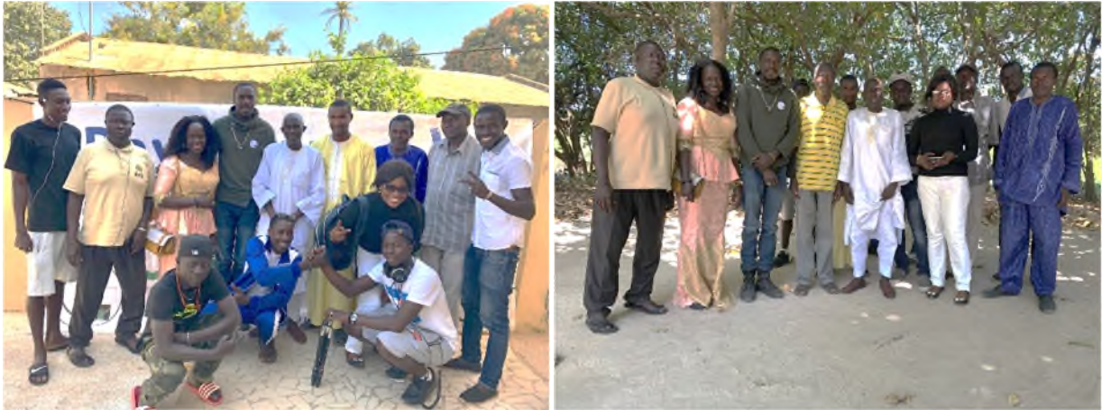
Abbildung 2 Team Bayo Sora Senegal; rechts mit Angehörigen von Abbé Diamacoune Senghor

Am ersten Tag der visite de courtoisie führen die Vertreter von Bayo Sora Senegal in Richtung Oussouye. Zunächst besuchten wir die Familie von Abbé Diamacoune Senghor (MFDC, gestorben 2007) in Sèngèlene.