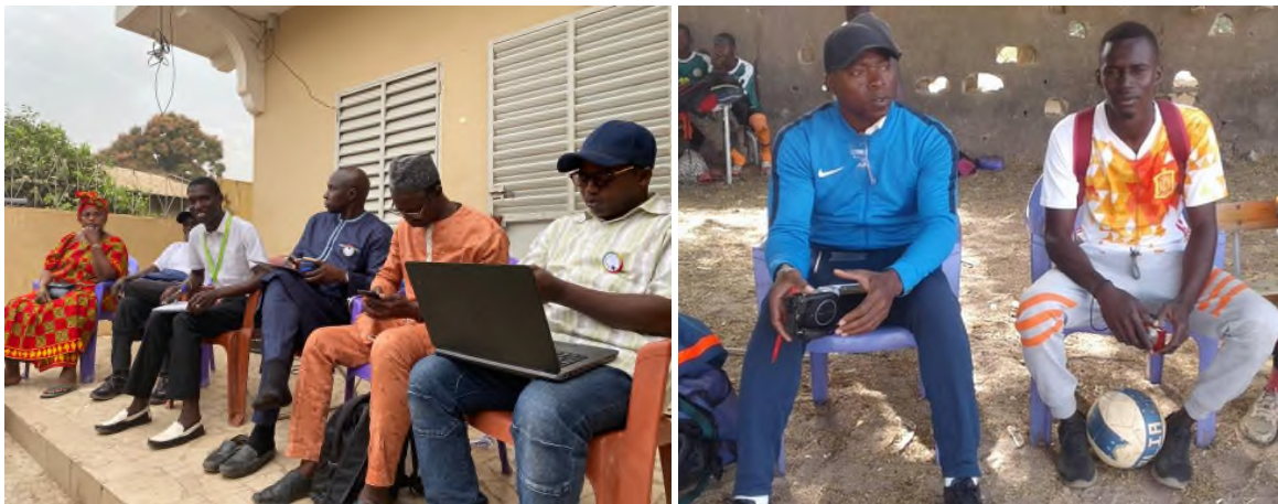
Abbildung 13 Links: Teilnehmer des Journée de réflexion; Rechts: Atenas Tendeng in blau

Für das Festival 2021 konnte sich die Arbeitsgruppe auch bereits auf ein Thema einigen: Frieden und Sport . Dieses Thema wird uns, den Verein vor Ort und die weltweite Diaspora in diesem Jahr in Form von verschiedenen Aktionen begleiten. Z.B. konnten wir den ehemaligen senegalesischen Fußball Nationalspieler und Trainer von Casa Sport (1. Fußball Liga) Atenas Tendeng als Teilnehmer und Förderer für das nächste Festival gewinnen.