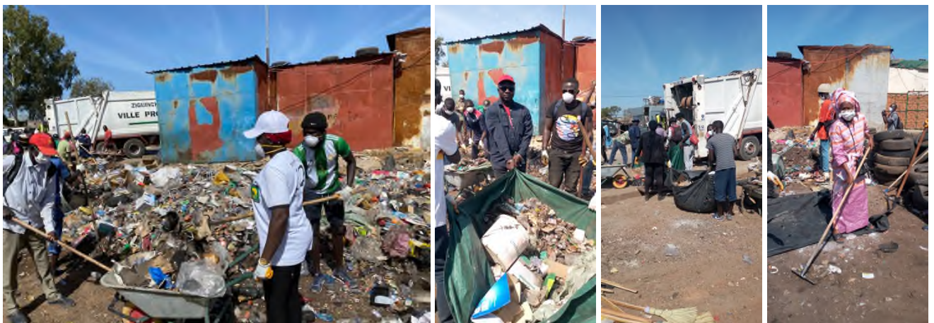
Abbildung 7 Große Reinigungsaktion am Busbahnhof von Ziguinchor; Im Hintergrund zu sehen: der Müllhaufen der Stadt Ziguinchor

Im Nachgang des Festivals würden wir gerne Mülleimer am Busbahnhof anbringen lassen, um die Sauberkeit auch zu erhalten. Die Verhandlungen mit der Stadtverwaltung von Ziguinchor wurden bereits geführt. Diese wird die Mülleimer zwar nicht anschaffen, aber wöchentlich leeren.