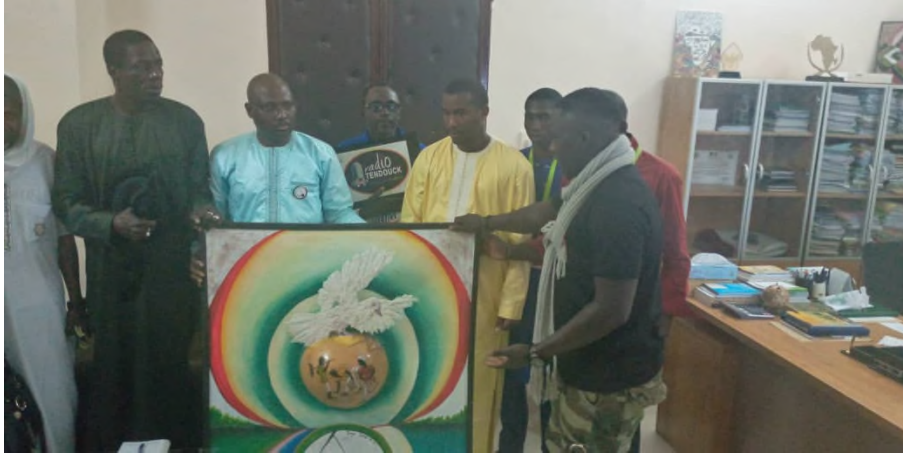
Abbildung 9 Das Team von Bayo Sora übergibt während der Höflichkeitsbesuche ein Kunstwerk an den Gouverneur von Ziguinchor Papa Guedjie Diouf

Am Freitag wurden wir vormittags von Papa Guedjie Diouf , dem Gouverneur von Ziguinchor, empfangen. Er sprach sehr positiv über das Festival und vor allem die Reinigungsaktion wenige Tage zuvor. Während unseres Höflichkeitsbesuchs überreichten wir ihm ein Kunstwerk von Künstler Lamine Bayo als Zeichen der Anerkennung.