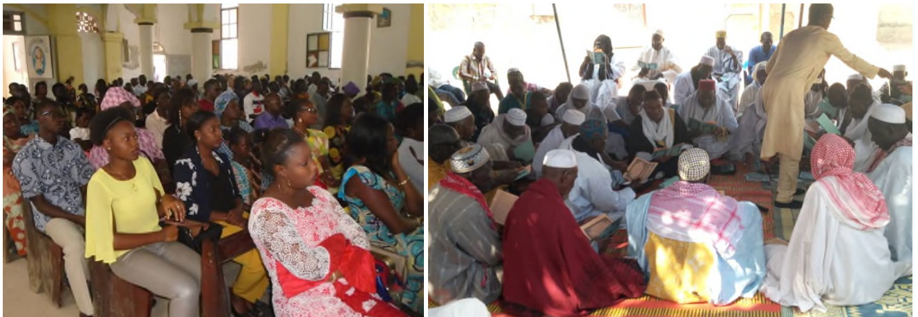
Abbildung 1 Interreligiöse Gebete für den Frieden und das Gelingen des Festivals in Ziguinchor

Den Beginn des Friedensfestivals bildeten auch in diesem Jahr interreligiöse Gebete, bei denen alle Konfessionen beteiligt waren. Muslime, Christen und Vertreter der Naturreligionen beteten gemeinsam für den Frieden in der Casamance und der Welt und für ein gutes Gelingen des Friedensfestivals.