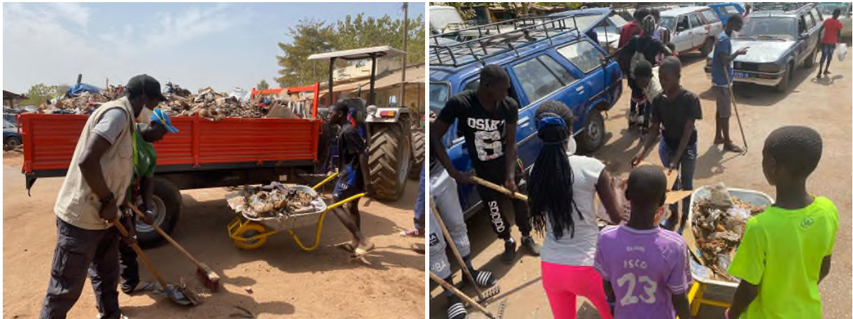
Abbildung 11 Große Reinigungsaktion am Busbahnhof von Bignona; rechts: auch die Kinder halfen begeistert mit. Ihnen liegt die Zukunft ihrer Region am Herzen

Die Leute, die die Aktion beobachteten, sprachen sich sehr positiv darüber aus und freuten sich sichtlich über die Initiative. Vor allem die Jugendlichen waren mit Feuereifer dabei und arbeiteten hart. Auch für die junge Bevölkerung in der Casamance ist Umweltschutz und die Bewahrung der Region eine große Herzensangelegenheit und sie nahmen die Gelegenheit, etwas zu tun, gerne wahr.