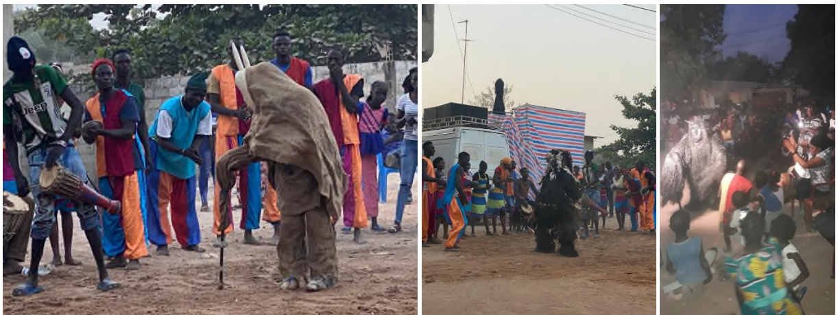
Abbildung 12 Traditioneller Maskentanz in Ziguinchor

Abends fand dann in Ziguinchor ein großer traditioneller Maskentanz mit der Groupe Ouweunk statt. Die reiche Kultur der Casamance hat einzigartige Masken hervorgebracht, deren Tradition gestärkt und erhalten werden muss in einer Welt, die immer moderner wird. Um die Kultur zu stärken, gehören traditionelle Maskentänze jedes Jahr zum Friedensfestival dazu.